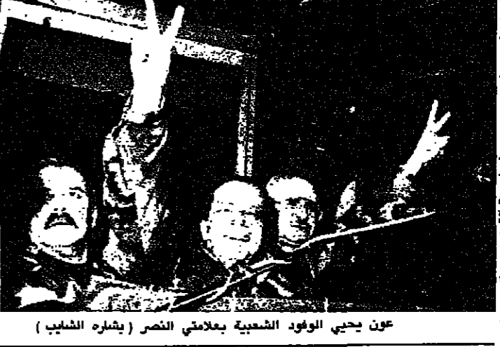
عون يجيب الوفود الشعبية بعلماي النصر (يشارة الشباب)

الانظار كلها مشدودة الى التحرك العربي والدولي. لايجاد مخرج للوضع اللبناني الراهن. في ظل تمسك كل فريق بموقفه وطروحاته. وفي حين يراهن الرئيس الهراوي على حل. ات على يد القوى الدولية النافذة. والتي محضتها للتأييد والدعم. فان العماد ميشال عون يراهن على نجاحه حتى الآن. في تجسيد مسيرة الطائف. ويدعو في آخر خطاب له مساء امس. الرئيس الهراوي والوزراء وكل الذين اعينهم الاحتمال الى الاستقالة فوراً. وللبلد قبل الغد. ليغضروهم التاريخ والشعب. لانهم استقالوا من الخط الذي ارتكبه بحق الوطن والشعب.